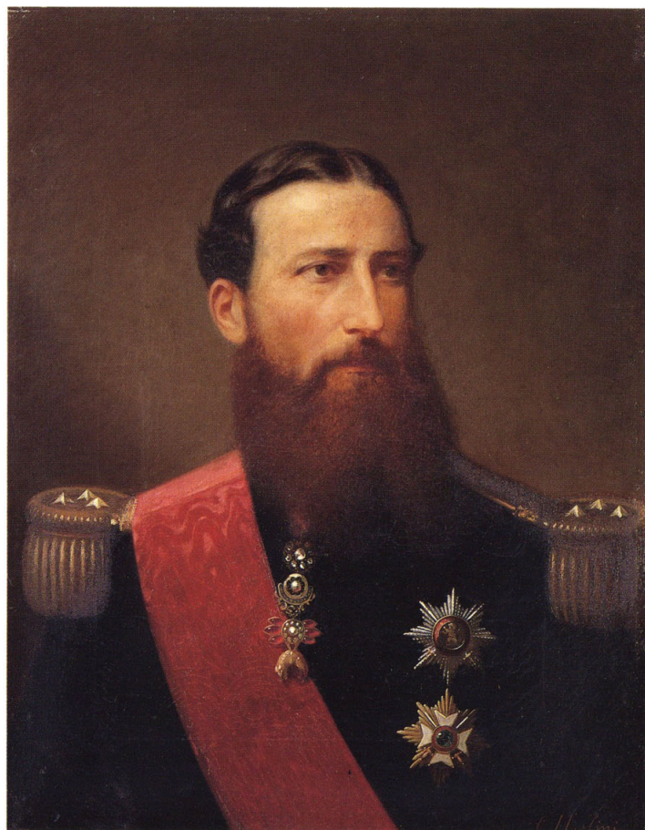
2-⑥ 白耳義皇帝(ベルギー国王:アルベール一世)