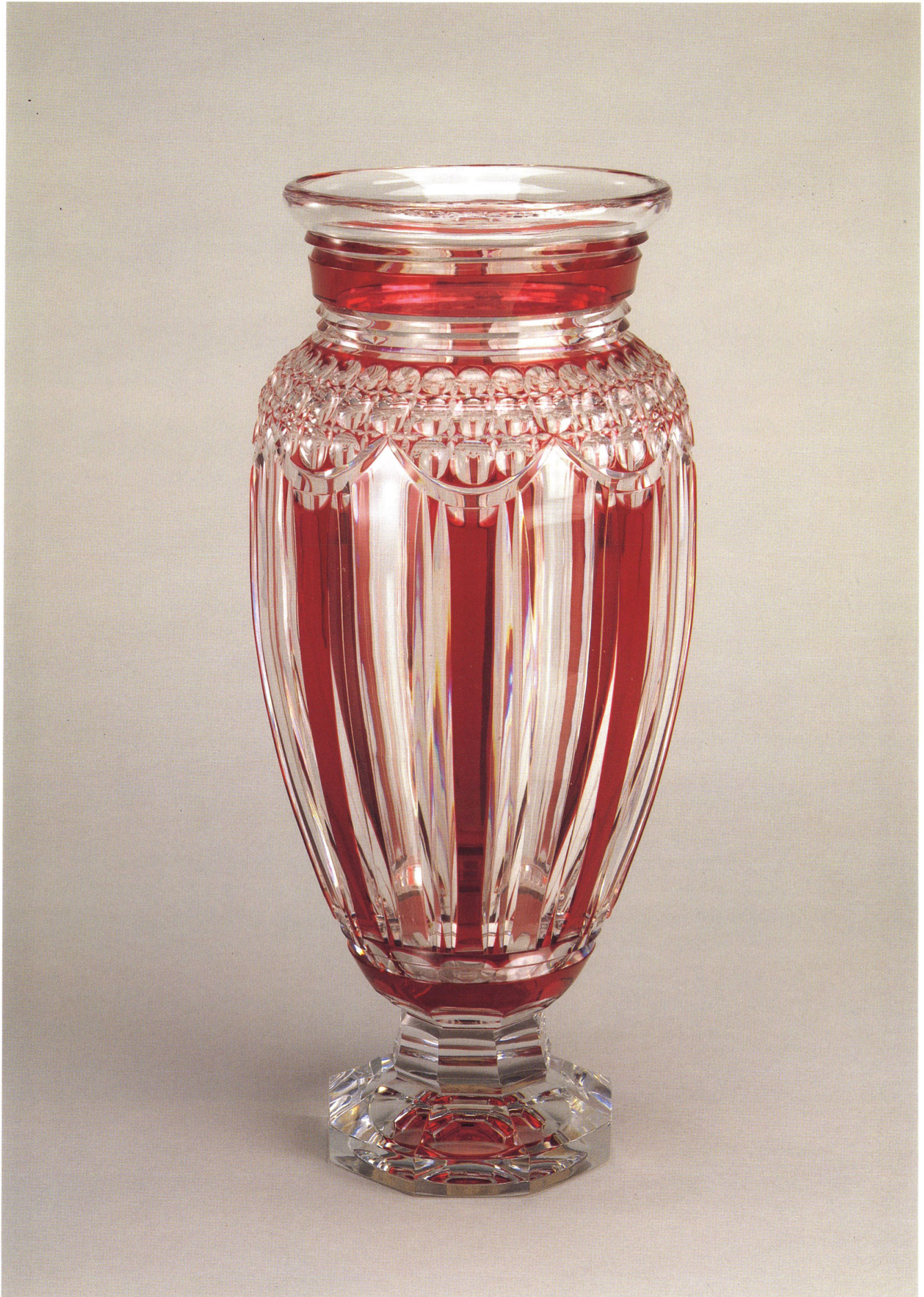
16 ヴァル・サン＝ランペール・クリスタル製作所 《赤被ガラス花瓶》 1928年 ガラス・赤色ガラス被せ・カット