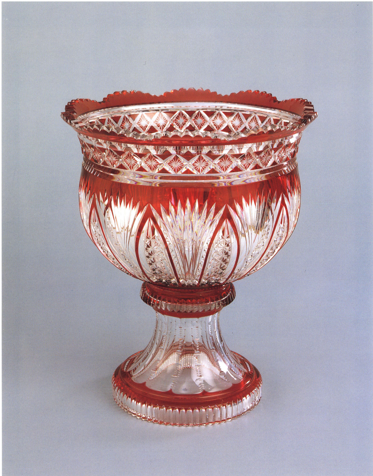
15 ヴァル・サン＝ランベール・クリスタル製作所 《赤被ガラス花盛器》 1924年 ガラス・赤色ガラス被せ・カット