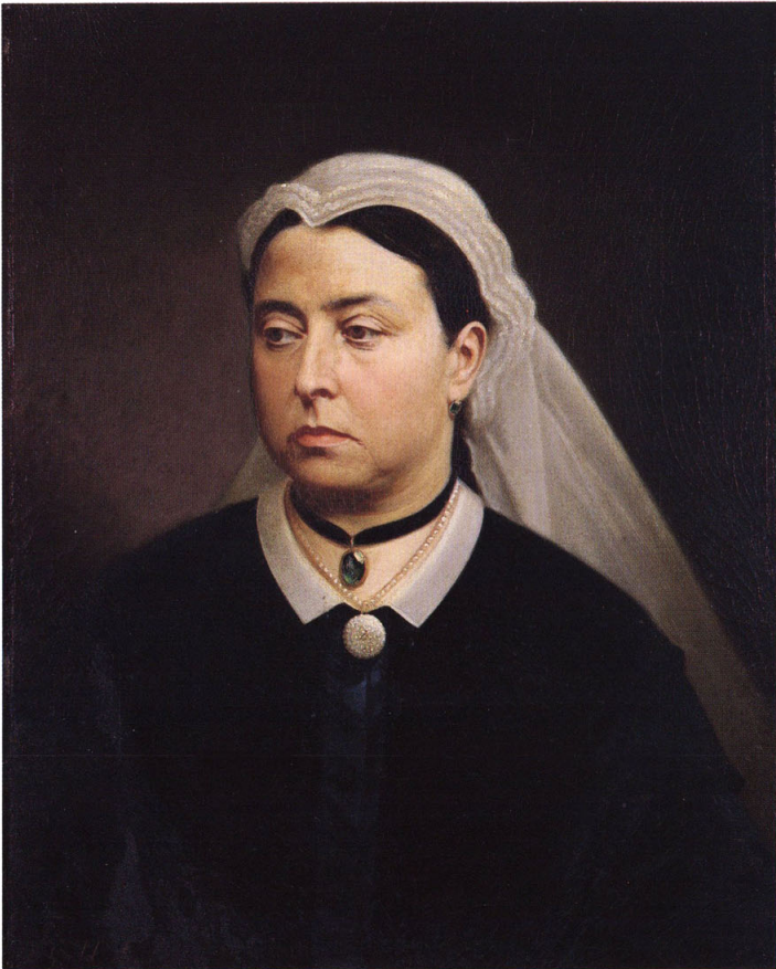
2-③ 英吉利皇帝(イギリス女王:ヴィクトリア)