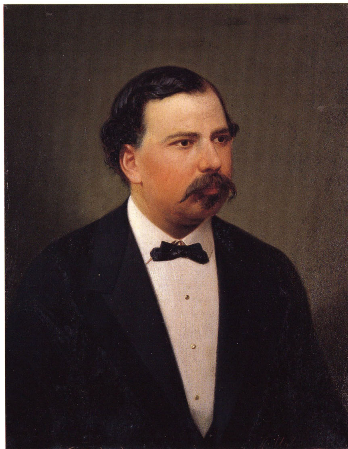
2-14 秘露大統領(ペルー大統領:マヌエル・バルド=イ=ラバッリエ)