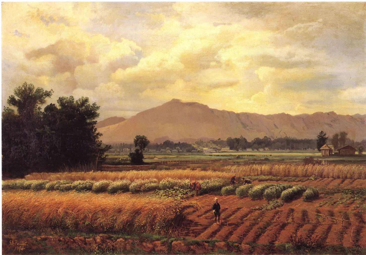
1 ジョ・バッタ・フェラーリ 《農村風景》(旧題:農業之図) 1875年 油彩・カンヴァス