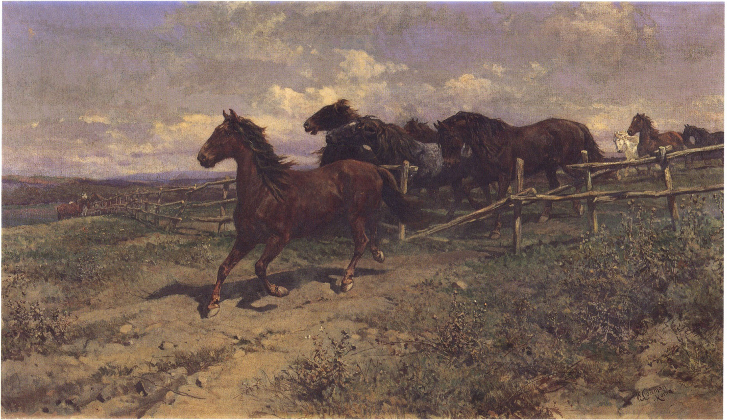
4 エンリコ・コールマン 《牧馬》 1870年頃 油彩・カンヴァス