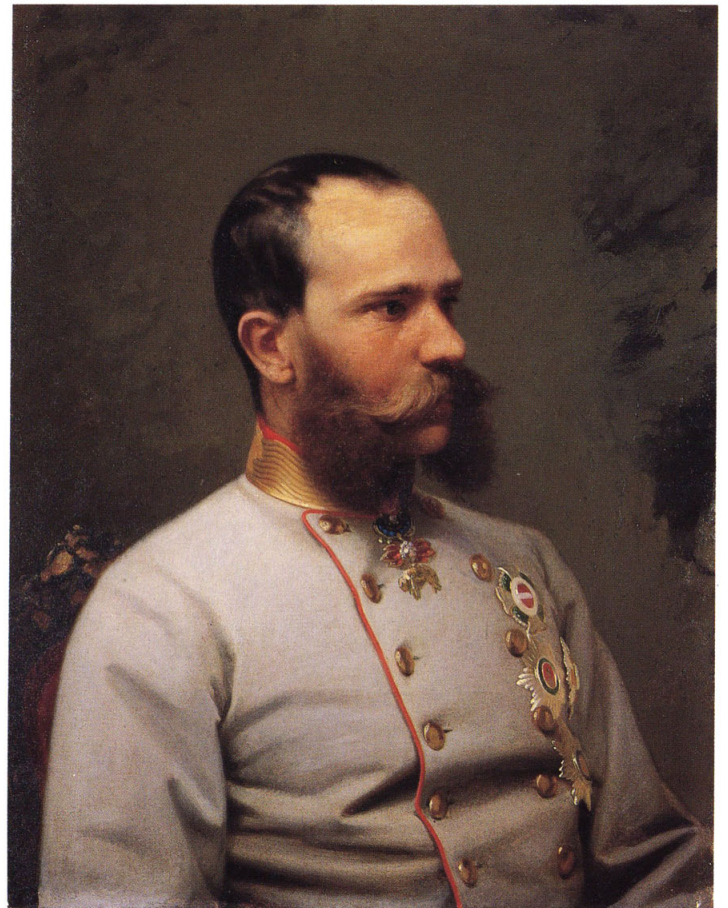
2-10 澳地利皇帝(オーストリア皇帝:フランツ・ヨーゼフ二世)