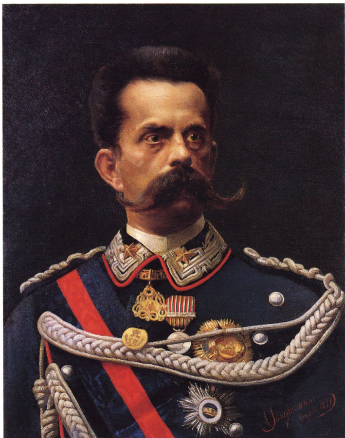
3-① 伊太利皇帝(イタリア国王:ウンベルト一世)