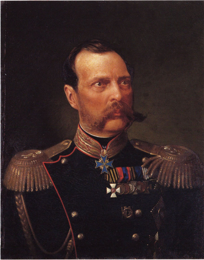
2-① 露西亞皇帝(ロシア皇帝:アレクサンドル二世)