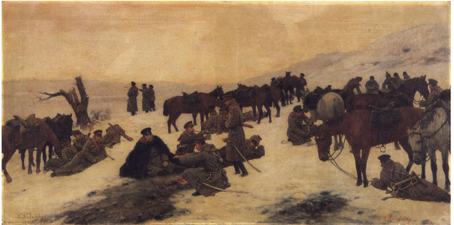
10 パヴェル=オシボヴィッチ・コワレフスキー 《兵士の休憩》(旧題:雪原野ロシア軍隊休憩の図) 1896年 油彩・カンヴァス