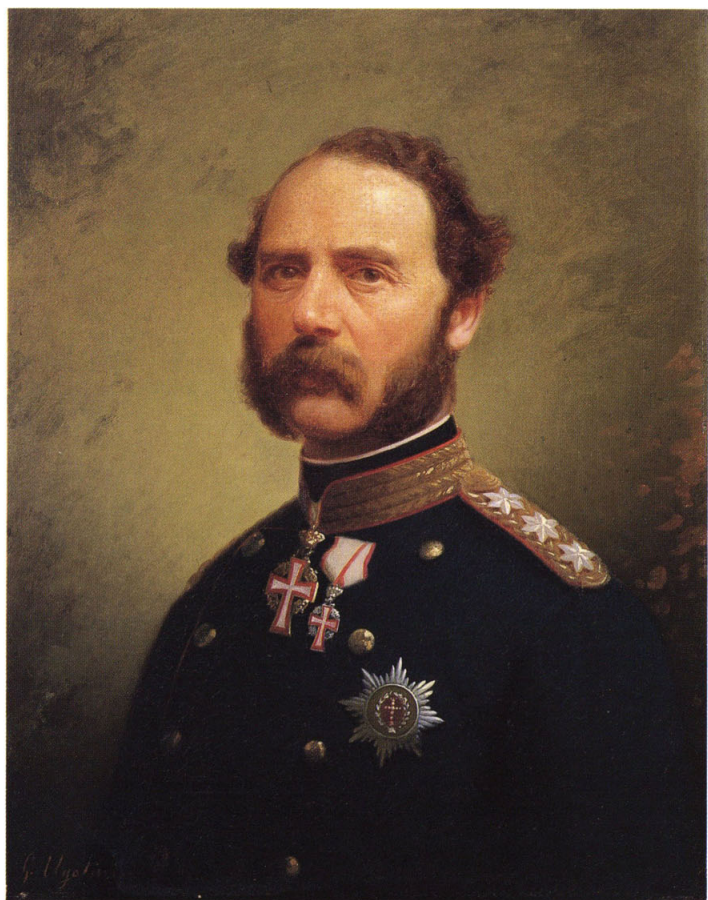
2-⑧ 丁抹皇帝(デンマーク国王:クリスチャン九世)