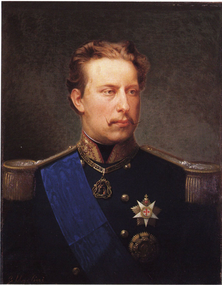
2-9 瑞典皇帝(スウェーデン国王:オスカル二世)