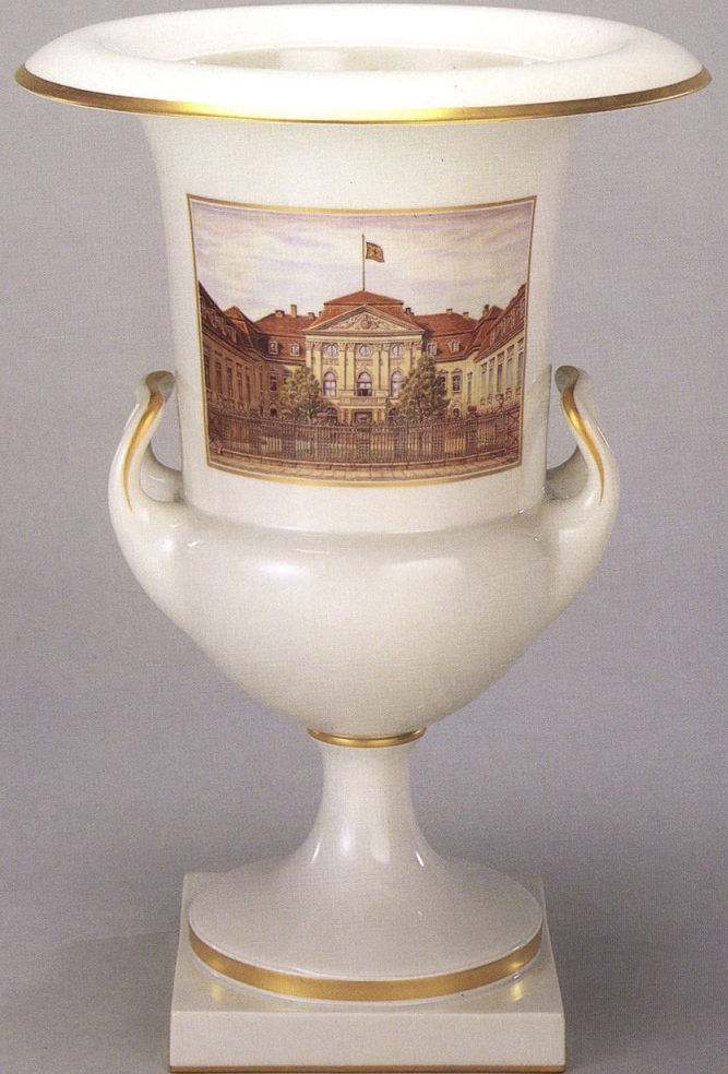
17 ドイツの工房? 《台付花瓶》一対 1939年 陶磁