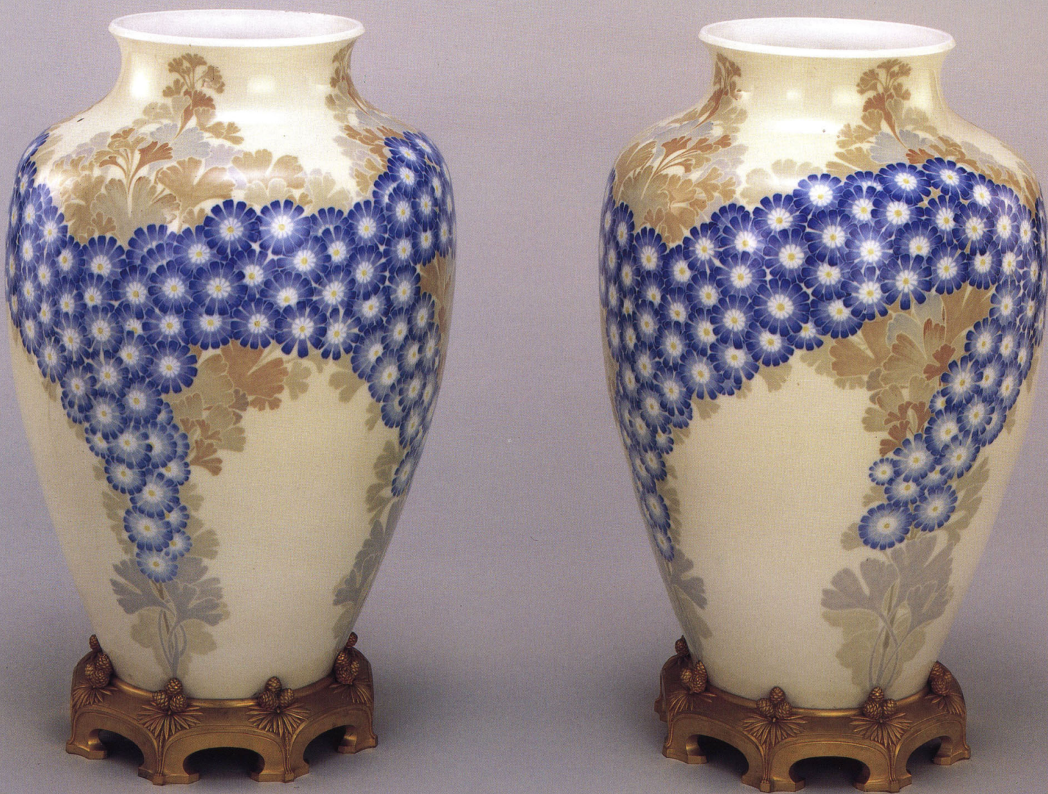
7 国立セーブル製陶所 《菊銀杏文花瓶》一対 1908年 陶磁