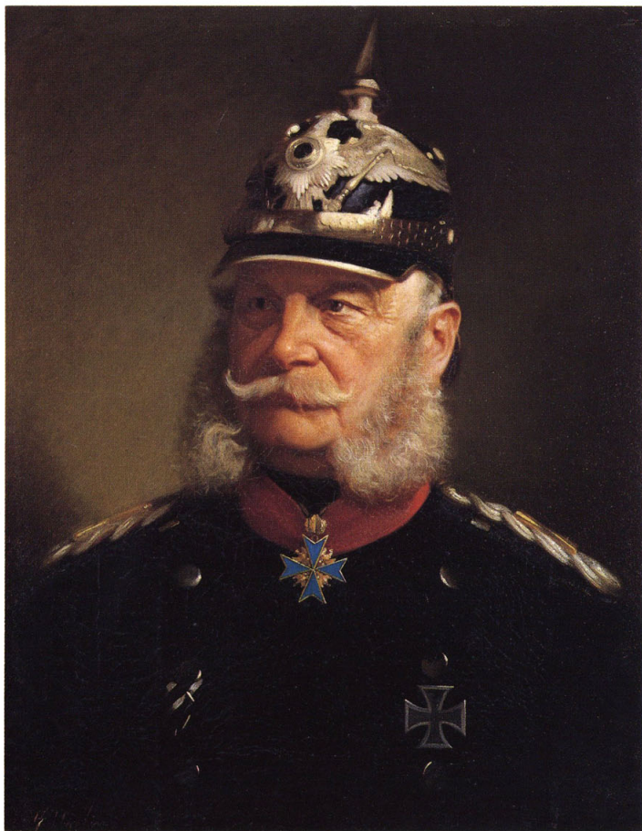
2-⑤ 獨逸皇帝(ドイツ皇帝:ヴィルヘルム)