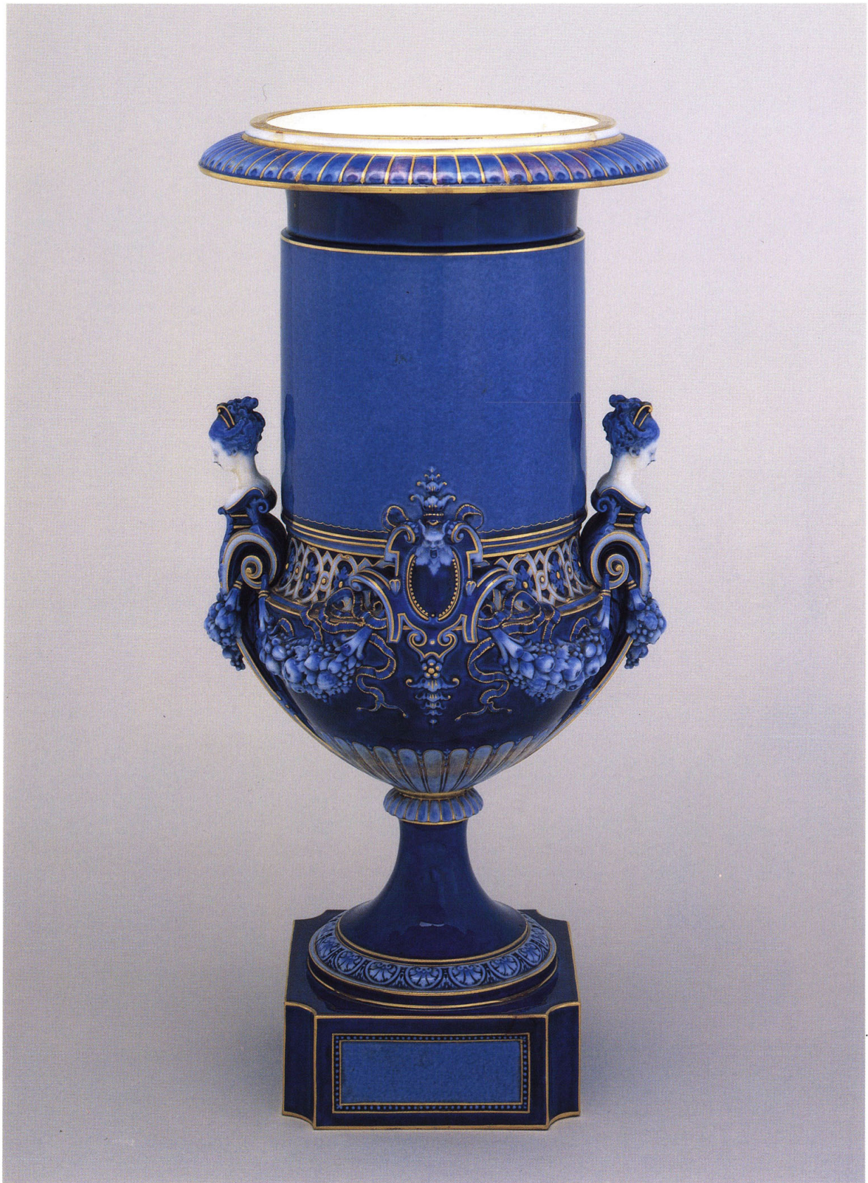
6 国立セーブル製陶所 《台付花瓶》 1882年 陶磁