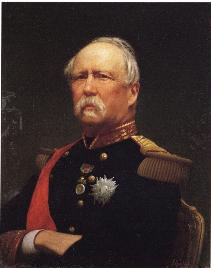
2-12 佛蘭西大統領(フランス大統領:パトリス・ドゥ・マクマホン)