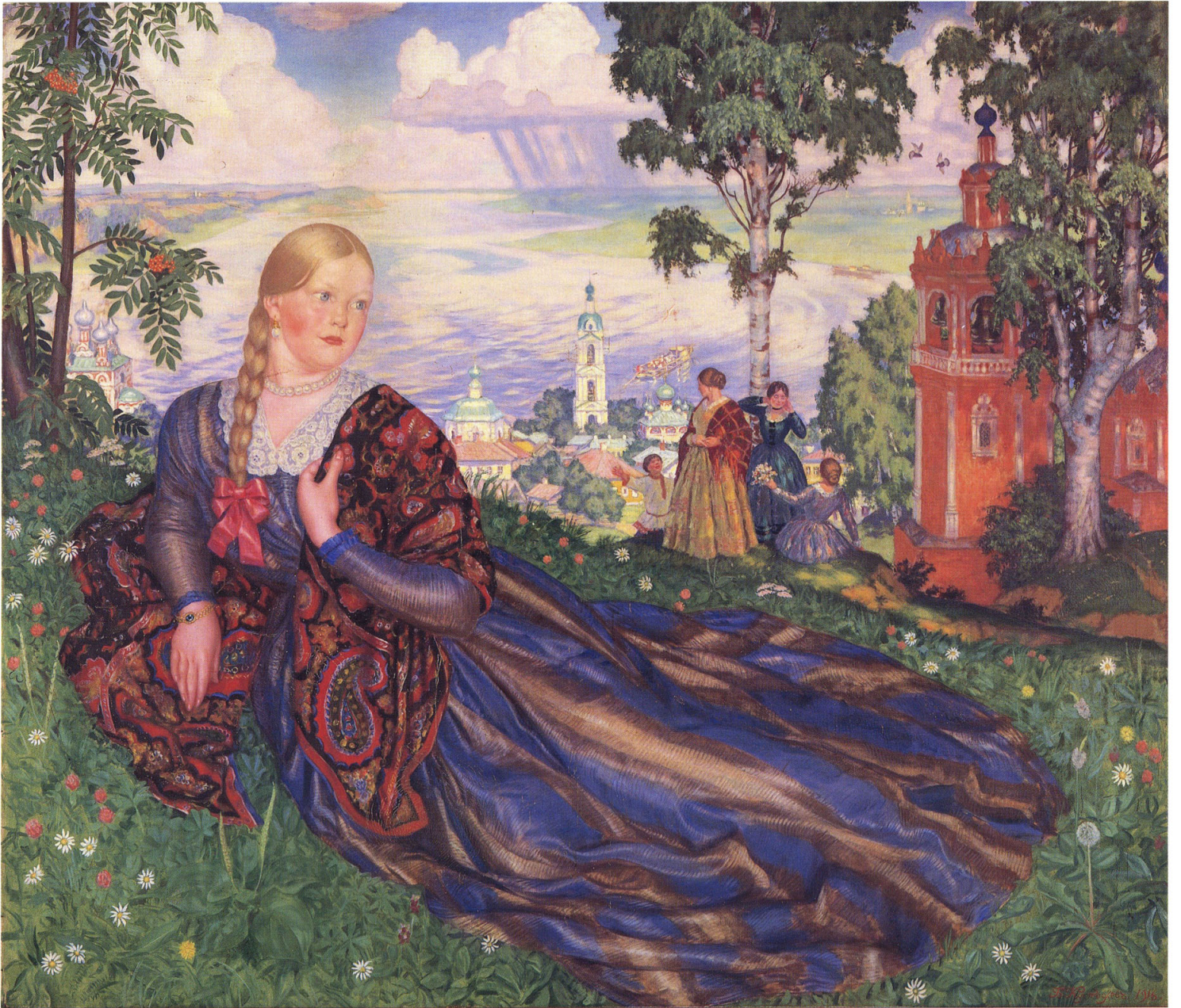
11 ボリス・クストージェフ 《ヴォルガ河畔の乙女》 1916年 油彩・カンヴァス