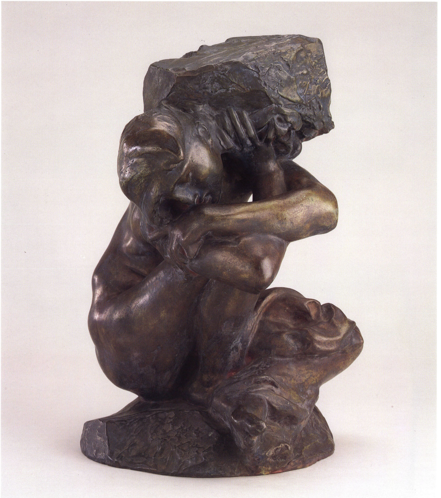
5 オーギュスト・ロダン 《うちひしがれたキャリアード》(旧題：女像置物) 1880～81年 ブロンズ