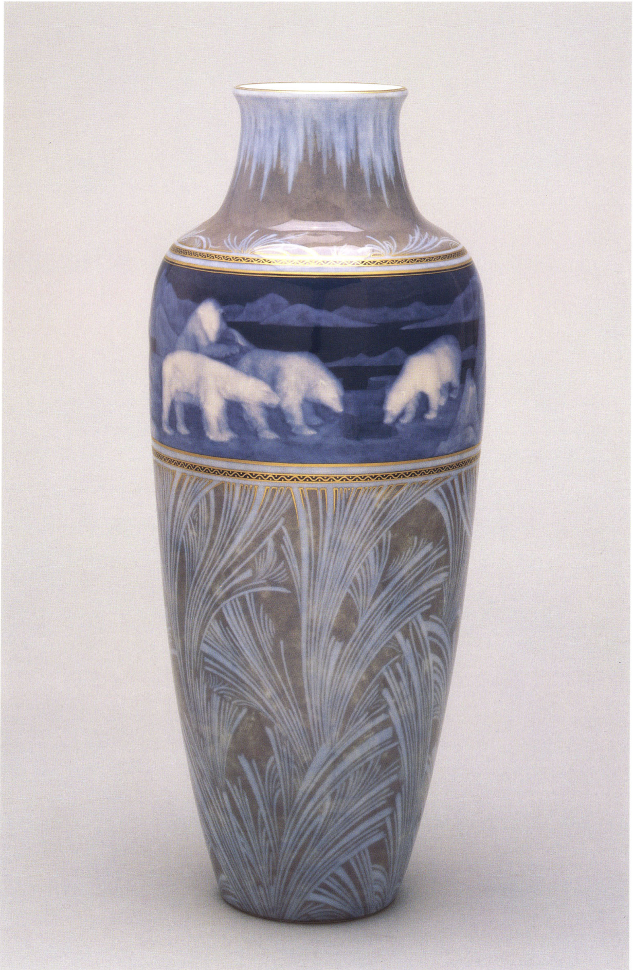
8 国立セーブル製陶所 《白熊文花瓶》 1920年 陶磁