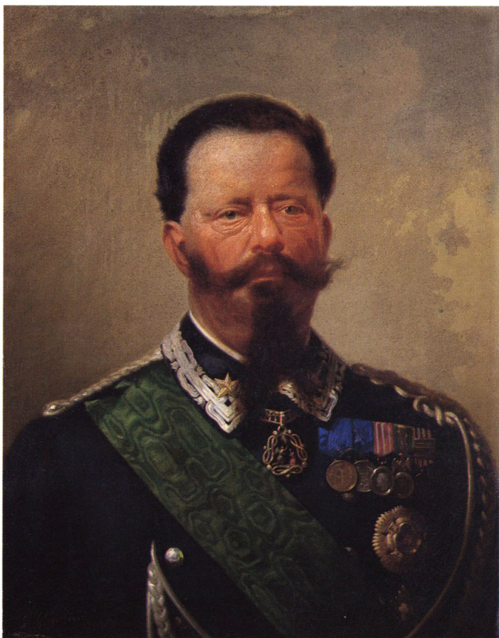
2-⑦ 伊太利皇帝(イタリア国王:ヴィットリオ・エマヌエル二世)