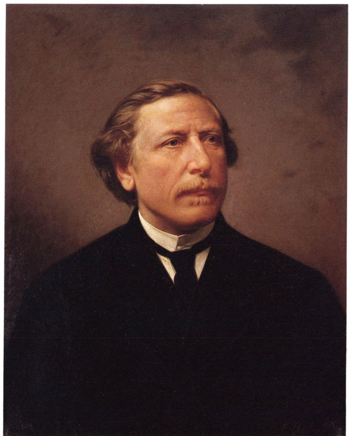
2-13 瑞西大統領(スイス大統領:ヤコブ・シェラー)