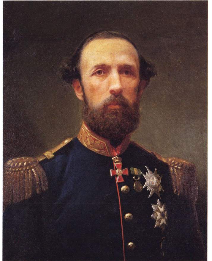
2-④ 葡萄牙皇帝(ポルトガル国王:ルイス一世)